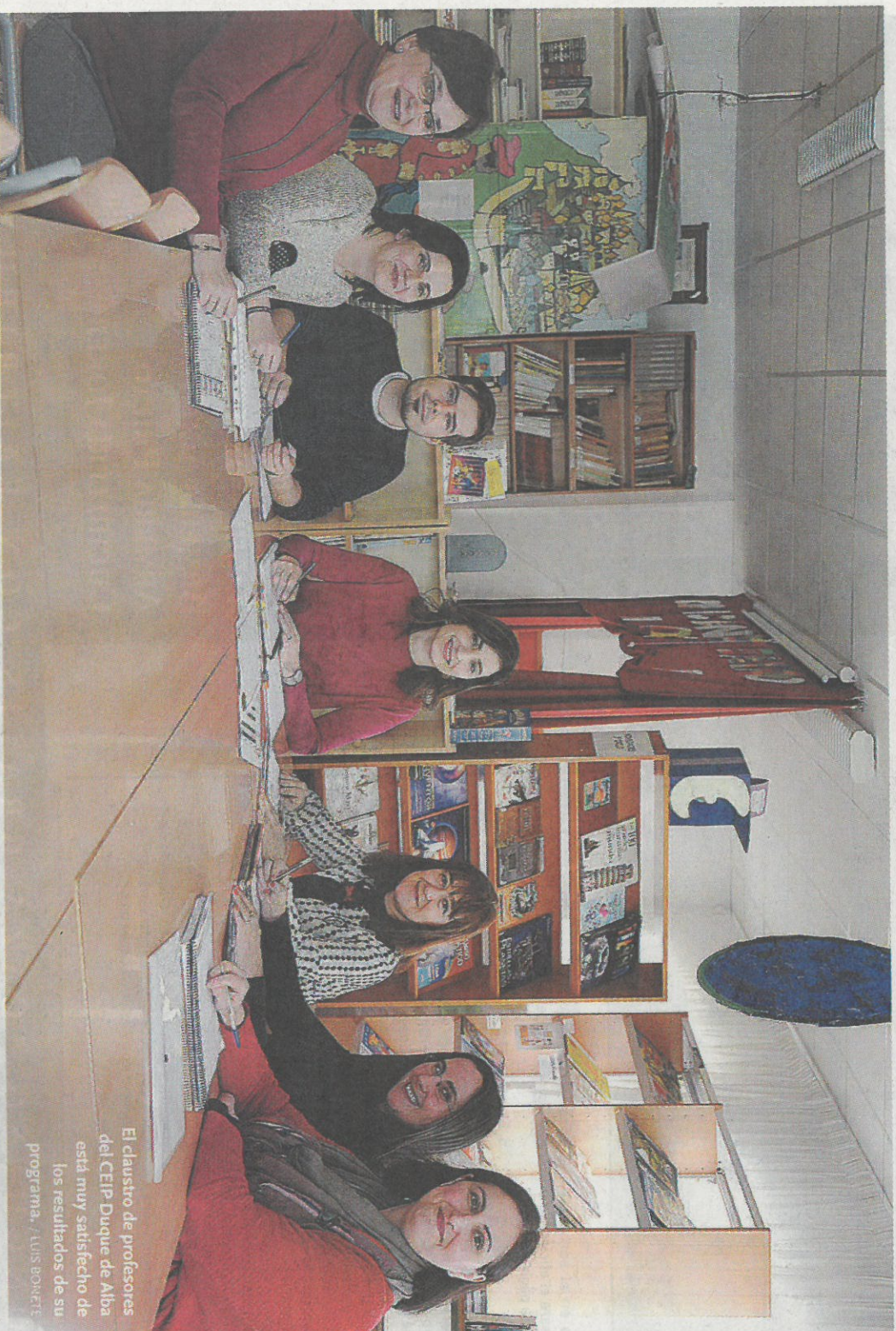
El claustro de profesores del CEIP Duque de Alba está muy satisfecho de los resultados de su programa.